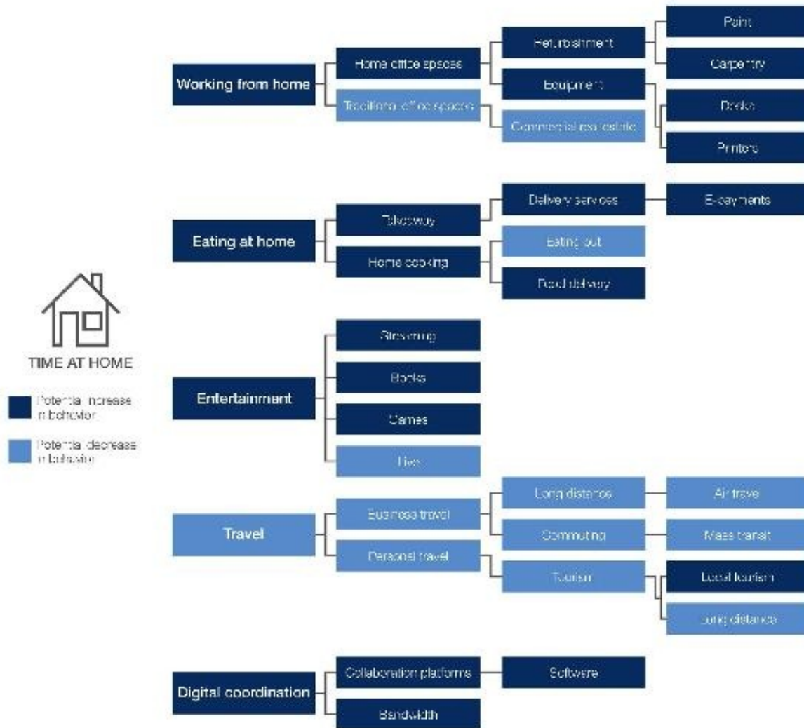
Abbildung 2: Mögliche Auswirkungen von mehr Zeit zu Hause